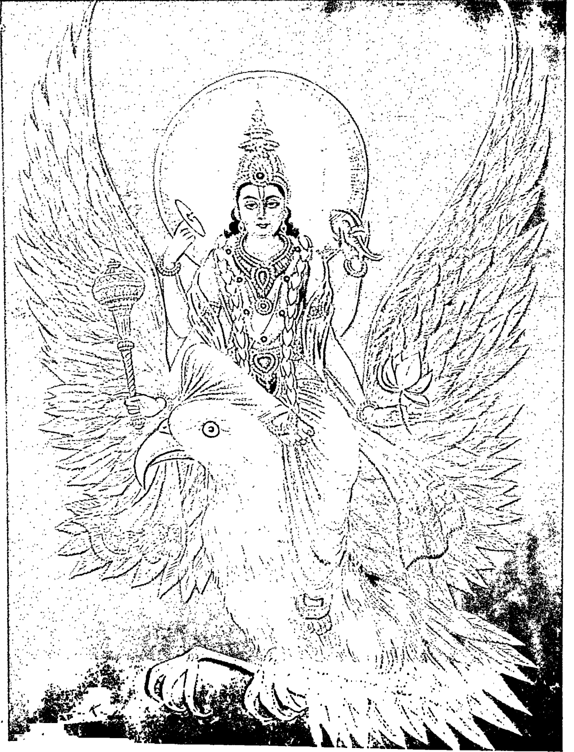
कर्मको कृतार्थ करनेवाले भगवान् श्रीहरि